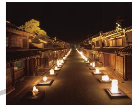
美濃和紙あかりアート展 (平成20年10月11日~12日開催)